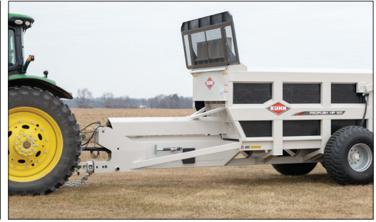
余裕のある旋回空間

請け負い作業に最適な精度の高い排出量調整が可能です。ボックス内側で突起になるガイドレールをなくし、開口高さを大きくすることで原材料の停滞やブリッジ現象が起きる可能性を減らしています。