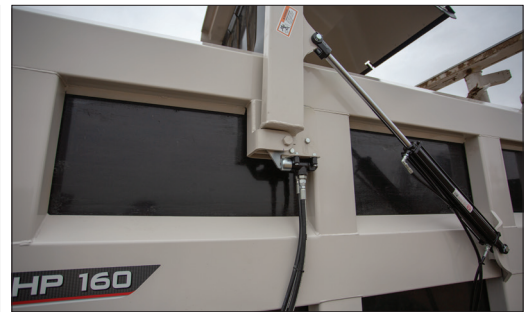
誤作動防止バルブ

左右に分割されたポリフロアは厚さ16mmで従来の床材よりも強度と耐久性に優れ、摩擦抵抗を低減しました。2分割することでスプレッダーに多大な重量の原材料が投下されてもより衝撃に耐えられるようになっています。10年の保証が品質と強度を裏付けています。