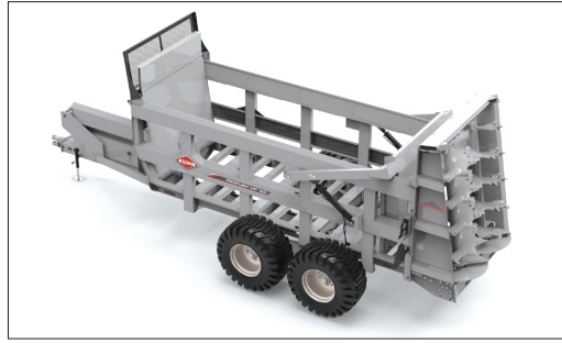
全鋼溶接フレーム