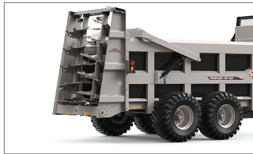
グレードアップした垂直ビーター