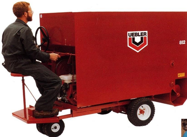
812型 1.5m 3