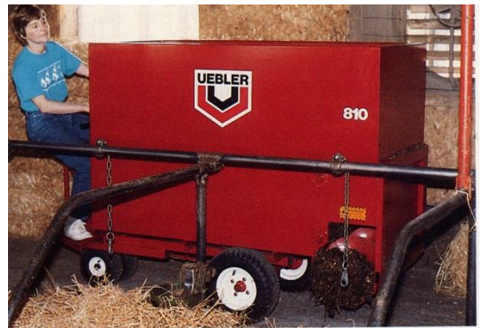
810型 1.0m 3