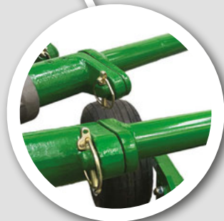
取り外し可能な タイヤアーム