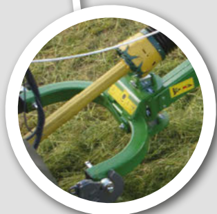
中心にある ヘッドストック