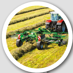
ヘビーデューティ デザイン