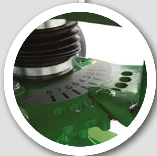
調整可能な タイヤアームカム