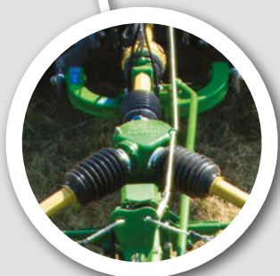
広角アングル ギアボックス