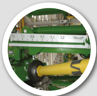
キャビン内での 作業幅調整